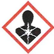
GHS08 Gesundheits- gefahr