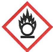
GHS03 Flamme über einem Kreis

Die gelagerte Bleiasche enthält größtenteils Bleioxid (ca. 85 Gew.-%), sowie weiterer Eisen- und Nicht-Eisen-Oxide und ist gemäß Verordnung (EG) Nr. 1272/2008 [CLP] als oxidierend, ätzwirkend, gesundheitsgefährdend und umweltgefährdend eingestuft: